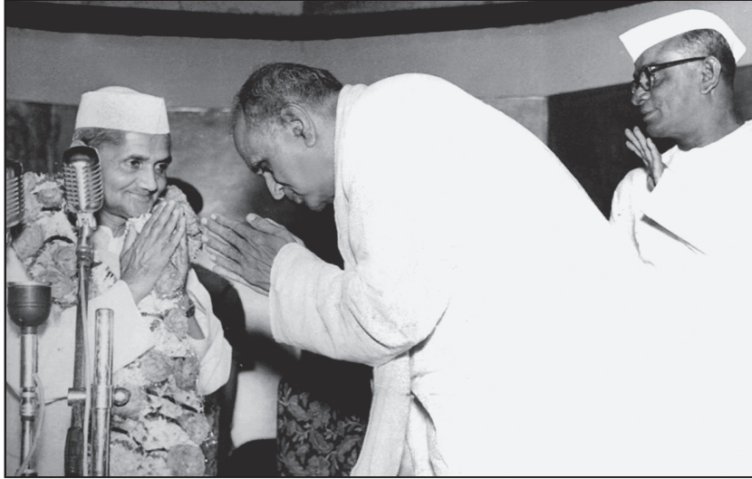
మాజ ప్రధాని శ్రీ లాల్ బహదూర్ శాస్త్రిగారితో శ్రీ గొట్టిపాటి బ్రహ్మయ్య